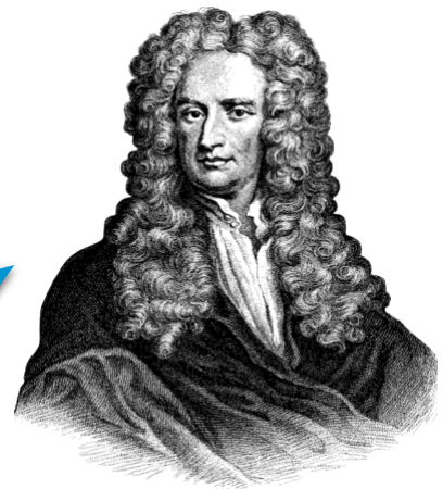
Isaac Newton, Physiker (1643-1727)

„Was wir wissen, ist ein Tropfen, was wir nicht wissen, ein Ozean.“